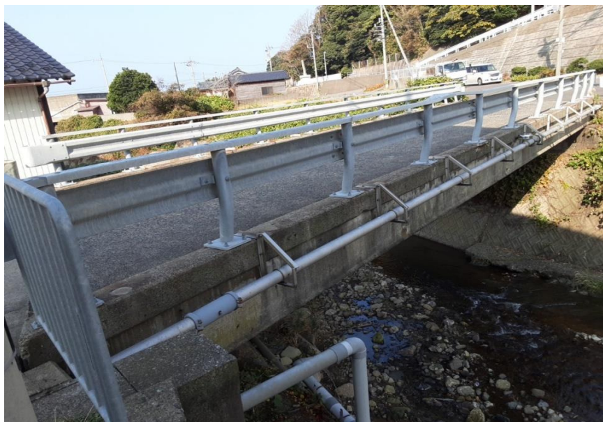
施工前 地覆部における塩害等による劣化状況