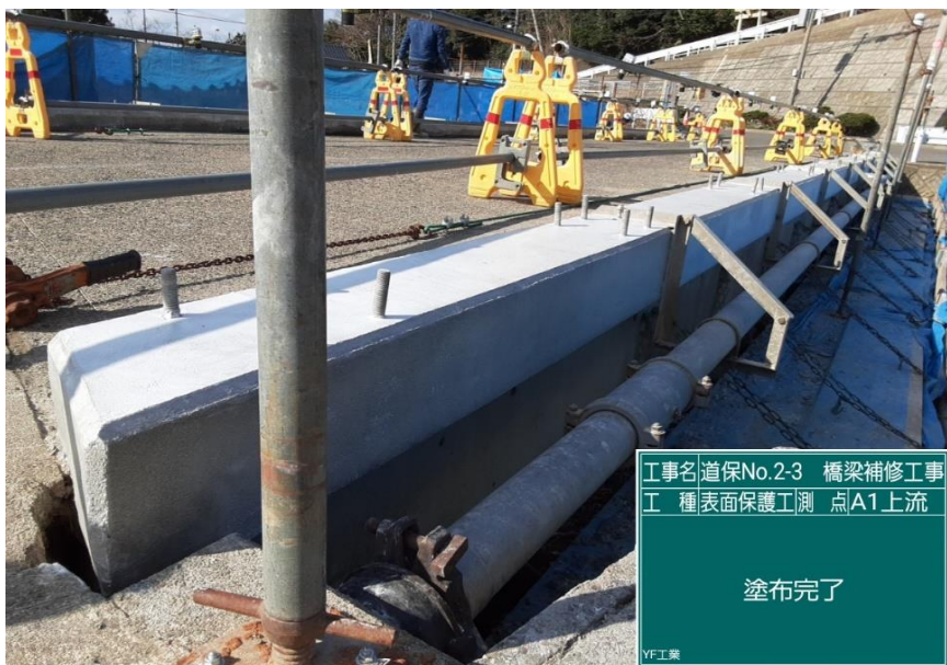
工事名 道保No.2-3 橋梁補修工事 工種 表面保護工 測点 A1上流 塗布完了 VF工業